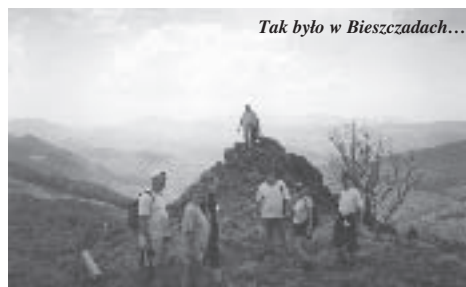
Tak było w Bieszczadach...

Z turystycznym pozdrowieniem Zygmunt Kot