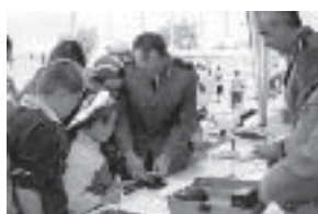
Policjanci z Laboratorium Kryminalistyki KWP nie mieli ani chwili wytchnienia, każdy chciał mieć swoje odciski palców.

Wystawa prac dzieci pt.: „Chcę być policjantem” zorganizowana przez Zespół Prasowy KWP z/s w Radomiu to nie jedyna atrakcja przygotowana z okazji Dnia Dziecka przez Policję. 2 czerwca, w sobotę, pod dwoma radomskim supermarketami „Hypernova” i „M1” odbyły się festyny z udziałem mazowieckich policjantów. Pod „Hypernową” tego dnia dzieci miały niepowtarzalną okazję zobaczyć jak pracują policjanci z Laboratorium Kryminalistyki KWP. Policjanci z tego wydziału zdejmowali odciski palców wszystkim chętnym dzieciom, potem dzieciaki otrzymywały je na pamięć oraz odlewali w gipsie ich odciski butów. Kolejną atrakcją był tor przeszkód, przygotowany przez policjantów z drogówki KMP i KWP w Radomiu, na którym