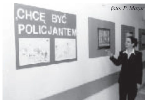
... a tak wyglądają na ścianach KWP z/s w Radomiu

Od tego dnia wszystkich wchodzących do budynku Komendy witają rysunki dzieci, które przedstawiają jak najmłodszy wyobrażają sobie codzienną pracę policjantów. Rysunki te powstały podczas Wielkiego Festynu Rodzinnego zorganizowanego przez KWP z/s w Radomiu w Muzeum Wsi Radomskiej w sierpniu ub. r. Dziś blisko 40 prac zdobi wejście i drugie piętro budynku. Już rok temu prace tych młodych artystów zaskoczyły i zachwyciły wszystkich. Dzieci okazały się wspaniałymi obserwatorami i na swoich rysunkach przedstawiły wszystko to, co kojarzy