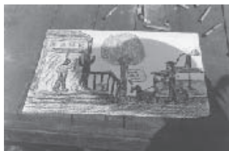
Tak powstawały rysunki podczas festynu rok temu...

Z okazji Dnia Dziecka 1 czerwca w budynku Komendy Wojewódzkiej Policji z/s w Radomiu otwarta została wystawa pt. „Chcę być policjan-